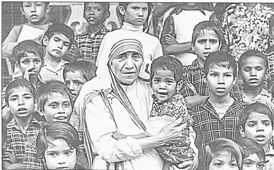
Мать Тереза считала, что величайший грех человека — это равнодушие к своим беспомощным братьям. 1980-е гг.

зять о человеке: он добрый! Ведь правда, нам хочется, чтобы нас окружали именно добрые люди! С ними легко, радостно, они всегда помогут, ободрят, заступятся, поддержат. Наверное, ваши родители часто говорили вам: «Расти добрым!» А что такое доброта? Как вы думаете, ребята?