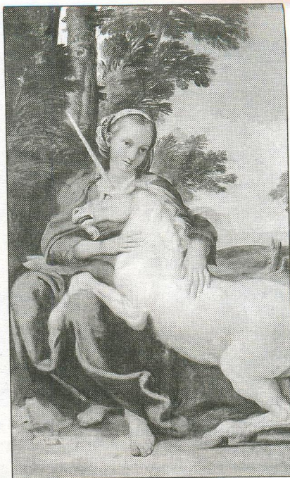
Дева с единорогом. Художник Доменикино. 1602 г.

КНИГОВОЙ: Я уверен, Русалочка, у тебя красиво получится.