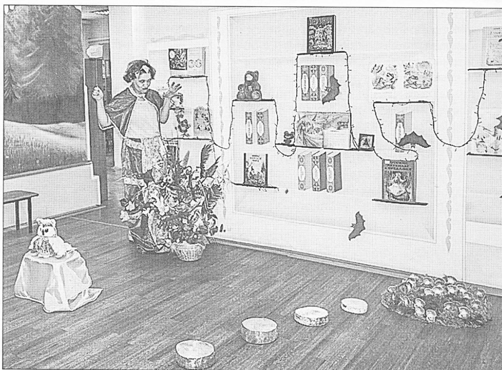
■ Путь к Кикиморе лежит по «кочкам» через «болото»

БИБЛИОТЕКАРЬ: Говорят, он охраняет дом. Бережёт жильцов и всё, что в нём. С детками,