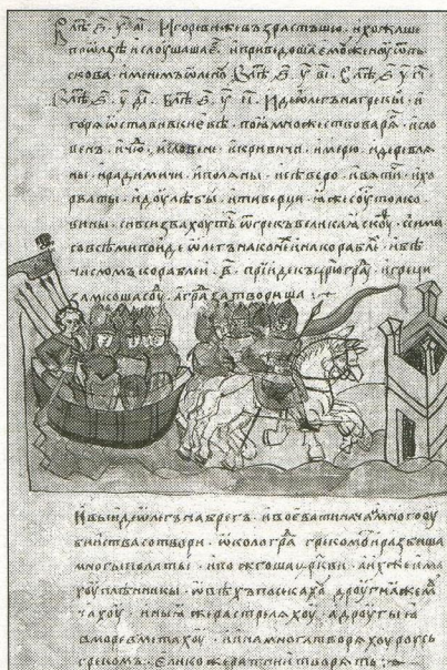
Поход Вещего Олега с дружиной на Царьград. Фрагмент Развивилловской летописи. XV в.

БИБЛИОТЕКАРЬ: В монастыре он нёс послушание летописца.