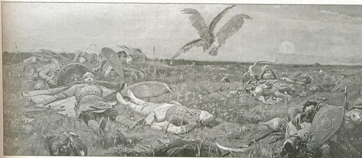
После побоища Игоря Святославича с половцами. Художник В. Васнецов. 1880 г.

БИБЛИОТЕКАРЬ: Нестор завещал печерским инокам-летописцам продолжение работы. Его преемниками стали игумен Сильвестр, придавший современный вид «Повести временных