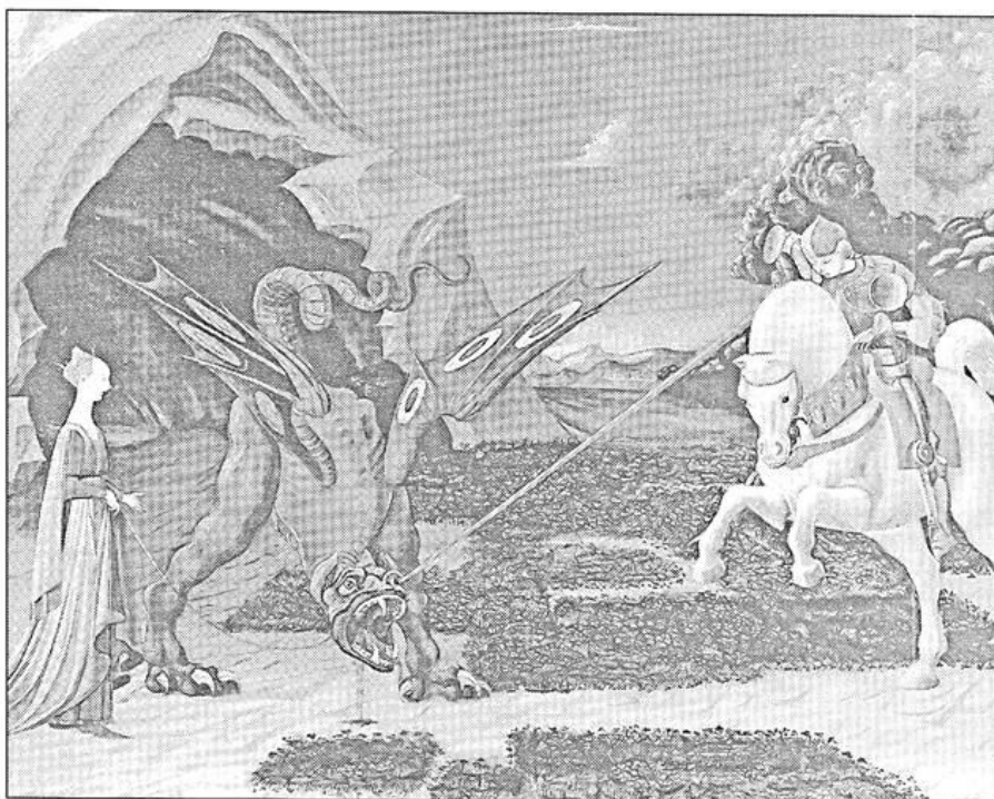
Битва святого Георгия с драконом. Художник П. Учелло. 1456 г.

ГЕОРГИЙ (Диоклетиану): О император, и вы, сенаторы и советники! Вы поставлены для соблюдения законов и праведных судов, а ныне утверждаете беззаконие и издаёте постановление о преследовании неповинных христиан, требуя от них поклоне-