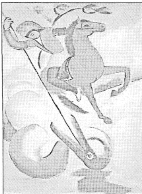
Святой Георгий. Художник А. Маке. 1912 г.

ВЕДУЩИЙ: Дерзость Георгия, его речь и непокорность вызвали гнев Диоклетиана. Он приказал бить святого по устам плетьюми «до тех пор, пока его плоть с кровью не прилипнет к земле».