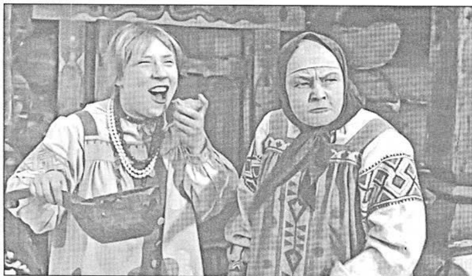
Жадные да ленивые в итоге всегда получают по заслугам! Фильм «Морозко». Режиссёр А. Рой. 1964 г.

сти. Быть настоящим человеком наедине со своей совестью значительно труднее, чем на глазах людей, оценивающих твои поступки, одобряющих добро и порицающих зло. Отчитываться перед своей совестью несравненно труднее, чем перед другим человеком».