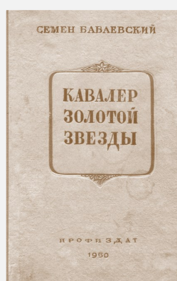
Обложка книги «Кавалер Золотой Звезды»

преодоления невиданной по своим масштабам разрухи, принесённой войной, Бабаевский видел беду литературы в том, что писатели «живут лишь сегодняшним днём... Не живут будущим. Поэтому многие произведения выходят какими-то бескрылыми...» Это и определило сюжетное построение его самого популярного романа, изданного в 1947 году, а затем и продолжения - романа «Свет над землёй». Книги имели невиданный для того времени успех. По признанию автора дилогии, его «почти носили на руках».