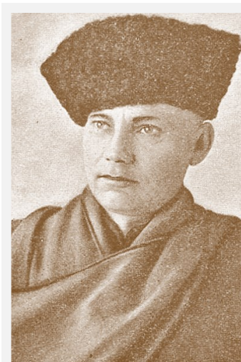
С. П. Бабаевский

Семён Петрович Бабаевский родился 24 мая (6 июня) 1909 года в деревне Кунье Харьковской губернии в бедной украинской семье, которая в 1914 году переселилась в «захолустный» хутор Маковский на Ставрополье. Здесь Семён познавал жизнь в детские годы, здесь родился как писатель, здесь находил героев для многих своих произведений – рассказов, повестей, романов. Он всегда гордился родным сердцу хутором, вскормившим его и благословившим на большую литературную дорогу.