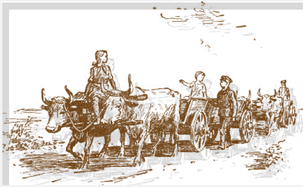
Иллюстрация к повести «Митино счастье»

Венгрию, Румынию, Иран, Бирму, Китай. Появились очерки «На румынской земле», книги очерков о жизни и работе китайских крестьян «Лицо земли» и «Ветви старого