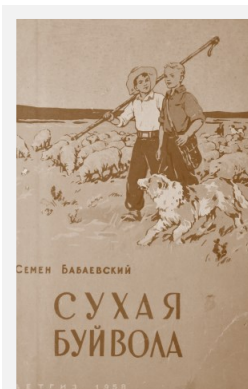
Обложка книги «Сухая Буйвола»

События, описанные в романах, относятся к 1945–1948