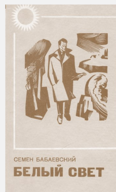
Обложка книги «Белый свет»

Уже через год в столичном журнале «Молодая гвардия» и в «Московском альманахе» были напечатаны его «Кубанские рассказы», получившие хорошую оценку известных писателей М. А. Шолохова и А. А. Фадеева.