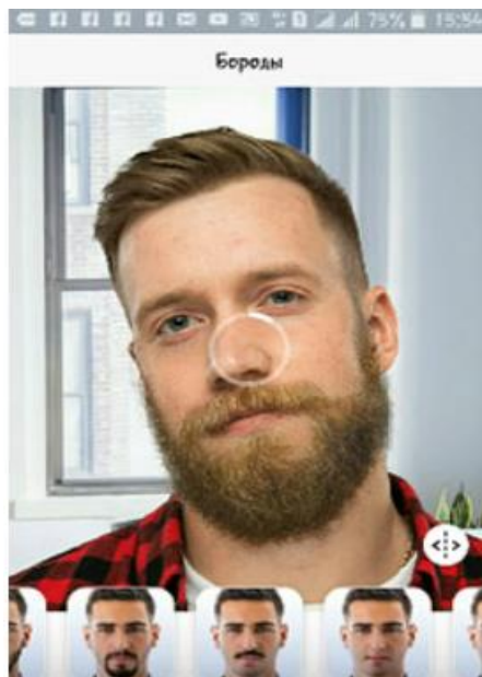
Подставьте усы или бороду в FaceApp