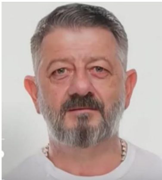
Михаил Галустян в старости через FaceApp